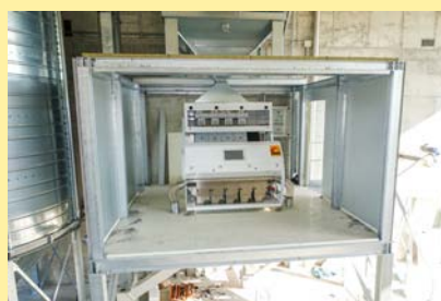
Impianto di selezione cereali.