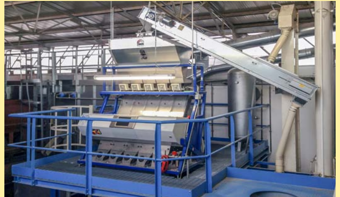
Impianto di selezione sementi.

Inserito nella tramoggia di carico, il prodotto da selezionare avanza sulla piastra vibrante fino a scorrere lungo uno scivolo inclinato, al termine del quale viene controllato singolarmente a 360° ed in caduta libera da telecamere full-color RGB (telecamere tricromatiche in versione standard) e da telecamere aggiuntive NIR ed InGaAs (opzione), posizionate sul fronte e sul retro del canale. In funzione dei segnali rilevati dal sistema ottico, il software di gestione comanda il dispositivo pneumatico che provvede a dividere fisicamente il prodotto da scartare da quello riconosciuto come "conforme" che, seguendo il flusso di caduta, raggiunge naturalmente la tramoggia di scarico. I prodotti da scartare sono invece deviati da un getto d'aria compressa emessa dall'elettrovalvola corrispondente ed indirizzati verso la tramoggia di scarico scarti, situata sul fronte della selezionatrice. Nelle versioni con ripasso automatico, il prodotto selezionato o scartato è convogliato in un'altra sezione della stessa macchina per subire un processo di lavorazione identico.